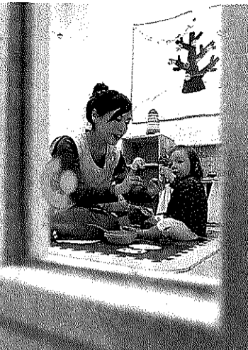
扉で仕切られた個室が設置されている病児保育施設 昨年12月18日、東京都港区南青山で

東京都心のマンション(東京・新宿)。もとも と、病児の自宅に向 見保育施設「まちかど 保健室」など。十二 月中旬のある日、病み 上がりの子ども一人が 保育スタッフに見守ら れていた。ベッドに扉 付きの個室、それに看 護師。回復期の子ども を預かる環境が、そこ にはある。